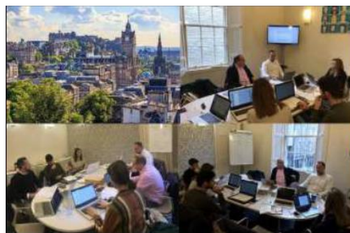
[Φωτογραφία από τη 2 η διακρατική συνάντηση στο Εδιμβούργο]